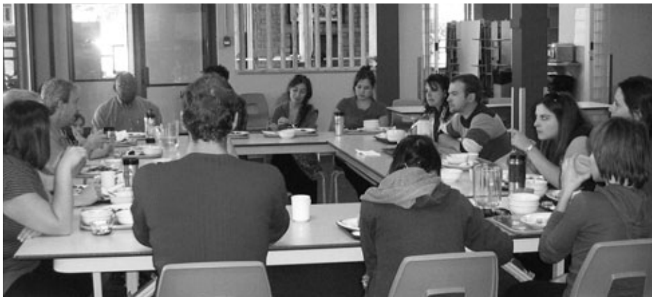
Des membres du Forum jeunesse en action.