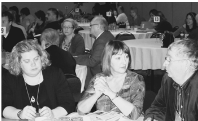
Quelques-unes des nombreuses personnes ayant participé au Rendez-vous régional des générations.

Le 21 octobre 2010 avait lieu au Centre des congrès de Rouyn-Noranda le Rendez-vous régional des générations. Cette activité, qui faisait suite aux Cafés des âges tenus à l'hiver dernier, avait pour but de dégager les principes et les pistes d'actions qui déboucheront sur un contrat renouvelé entre les générations : la Déclaration des générations. De courtes présentations théâtrales ont favorisé une prise de conscience des points de vue pouvant être portés tant par les jeunes que par les générations âgées. S'en suivaient des échanges entre les participantes et participants présents dans la salle à partir de questions touchant la famille, le pouvoir, la santé ainsi que le travail et l'éducation. Par la suite, des discussions en ateliers se sont déroulées au cours de l'après-midi. Globalement, on peut retenir que les citoyennes et les citoyens sont préoccupés par le vieillissement de la population et qu'il est urgent et primordial de créer des lieux et des occasions de rencontres entre les différents groupes d'âge. En atelier, les équipes intergénérationnelles ont dégagé 24 pistes d'actions attrayantes. L'Institut du Nouveau Monde s'inspirera des pistes d'actions identifiées dans chacune des régions du Québec pour rédiger la Déclaration des générations.