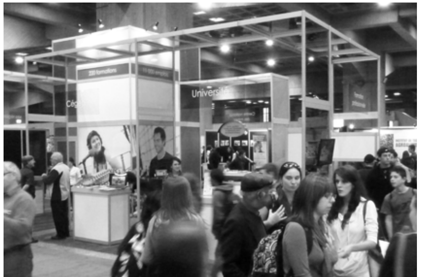
Kiosque de l'Abitibi-Témiscamingue au Salon national de l'éducation et de l'emploi.

Afin d'avoir une force d'impact plus importante, les quatre organismes ont décidé de construire un grand kiosque regroupant cinq emplacements. L'objectif était de créer un espace « Étudier et travailler en Abitibi-Témiscamingue ». Ce fut une mission réussie puisque la région s'est fortement démarquée. Ce projet concerté avec le milieu démontre une fois de plus la volonté de promotion régionale.