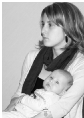
Ci-dessus, l'une des plus jeunes personnes présentes à l'activité.